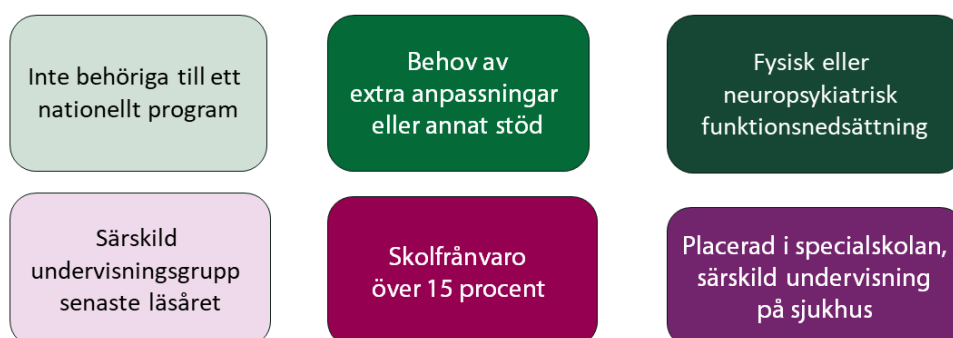
Figur 1. Elevgrupper i behov av övergångshandlingar.

I den gemensamma rutinen beskrivs den organisatoriska rollfördelningen i arbetet dels för mottagande skola, dels för avlämnande skola. För likvärdighet i arbetet har grundskoleförvaltningen och gymnasie- och vuxenutbildningsförvaltningen beslutat att avlämnande skola alltid ska göra en bedömning av vissa elevgrupper för att avgöra huruvida en överlämning är nödvändig. Figur 1 visar en sammanställning över elevgrupper i behov av övergångshandlingar.